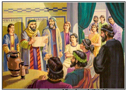
ஆதார வசனங்கள் : அப்போஸ்தலர் 15:1-35

திறவுகலம் : "காத்தாராகிய இயேசுகிறிஸ்துவின் கிருபையினாலே அவர்கள் இராட்சிக்கப்படுகிறது எப்படியோ, அப்படியே நாமும் இராட்சிக்கப்படுவோமென்று நம்பியிருக்கிறோமே என்றான்" - அப்போஸ்தலர் 15:11