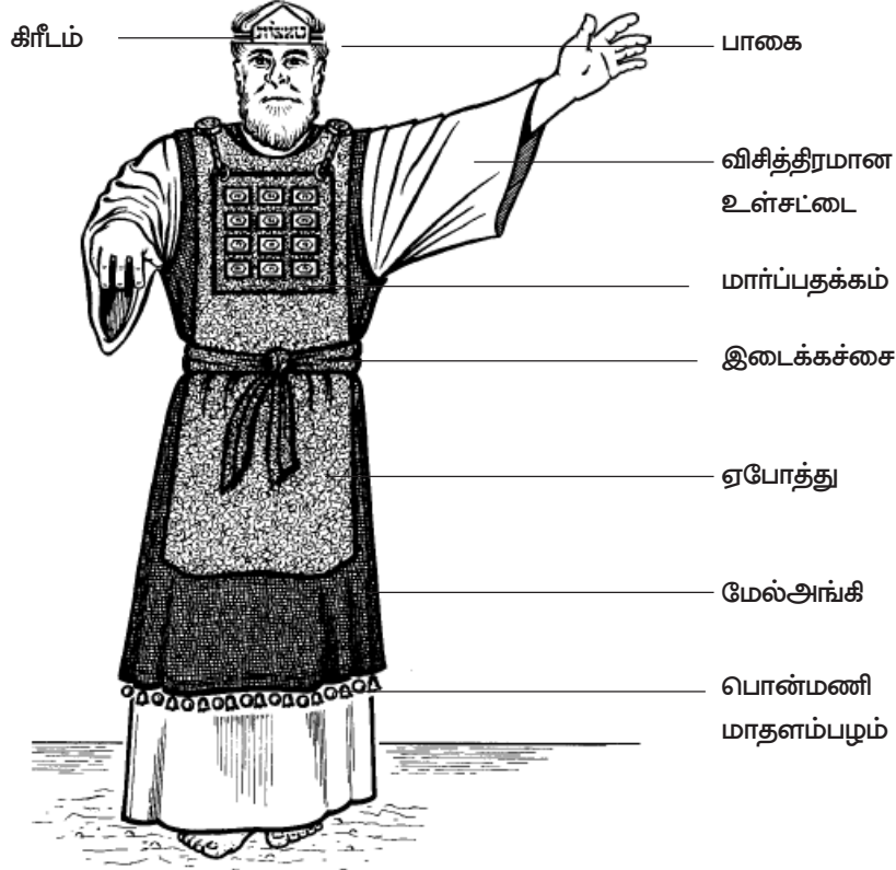
பிரதான ஆசாரியனின் வரைபடம்

ஆபிரகாமின் மாம்சீக சந்ததியாரான மாம்ச இஸ்ரவேலர்கள், ஆசீர்வதிக்கும் பணியில் இருக்க மாட்டார்கள். அப்போஸ்தலன் சொல்கிறார் : “சுவிசேஷத்தைக் குறித்து (உடன்படிக்கையின் ஆவிக்குரிய பாகம்) அவர்கள் (மாம்ச வித்து) உங்கள் நிமித்தம் பகைஞராயிருக்கிறார்கள்; தெரிந்து கொள்ளாததைக் குறித்து அவர்கள் (இன்னும்) பிதாக்களினிமித்தம் அன்புகூறப்பட்டவர்களாயிருக்கிறார்கள். தேவனுடைய கிருபைவரங்களும், அவர்களை அழைத்த அழைப்பும் மாறாதவைகளே. நான் அவர்களுடைய பாவங்களை நீக்கும்போது, இதுவே நான் அவர்களுடைய செய்யும் உடன்படிக்கை - இந்த பிரகாரம் இஸ்ரவேலரெல்லாரும் இரட்சிக்கப்படுவார்கள். மீட்கிறவர் இந்த